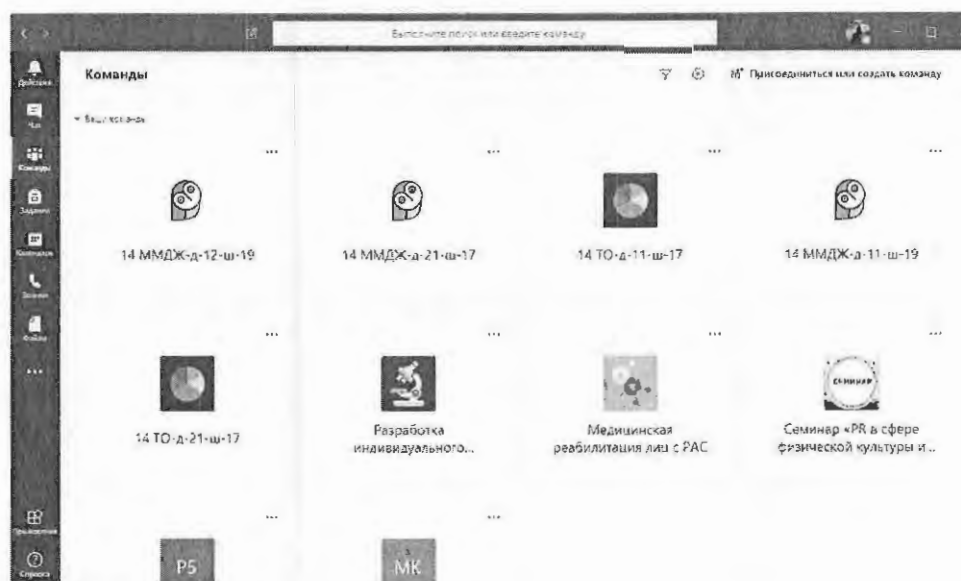
Общий вид страницы преподавателя в TEAMS

После обеспечения обучающимся возможности входа в систему, создается навигация, понятная не только им, но и родителям (законным представителям). Преподаватель является администратором и может создавать учебные группы, команды, систематизируя обучающихся к процессу обучения в колледже.